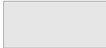
أبيض صدفى ثلاثي الطبقات