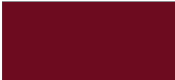
أحمر داكن معدني