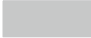
فضي جليدي معدني