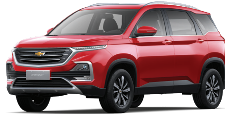
GLAZE RED METALLIC