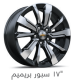
17" سبور بريميم