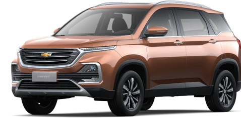
EARTH BROWN METALLIC