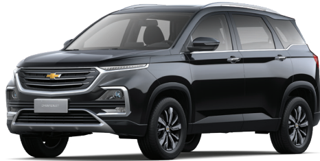
STAR TWINKLE BLACK METALLIC