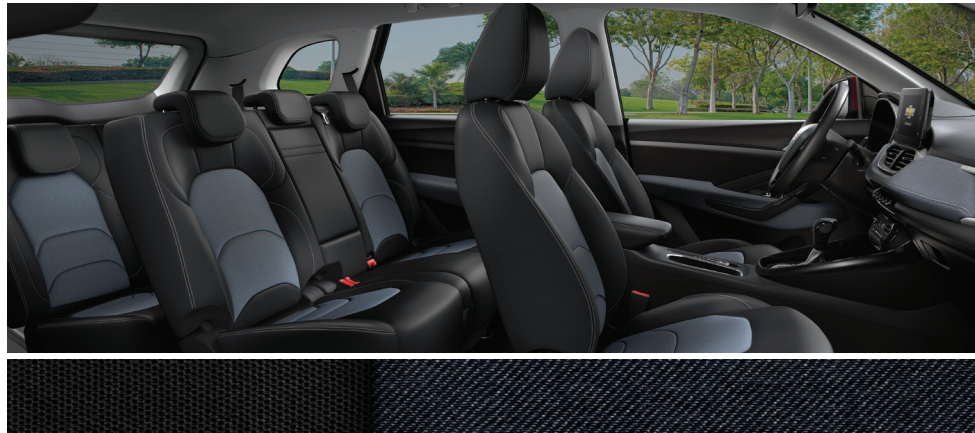
BLACK & BLUE CLOTH