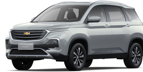
AURORA SILVER METALLIC